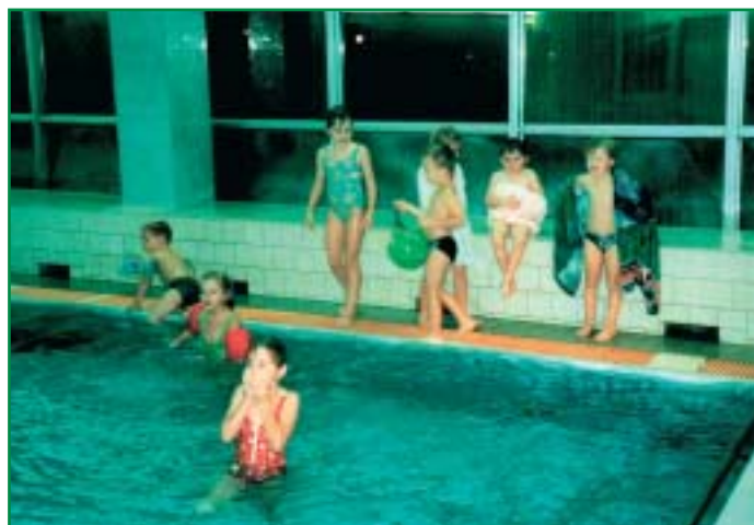
Na bazénu v Přerově