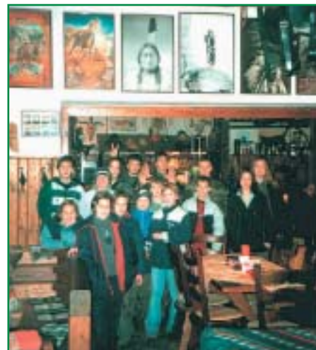
U posledního Mohykáma ve Vojtěchově

Internet na Obecním úřadě v Dubu nad Moravou