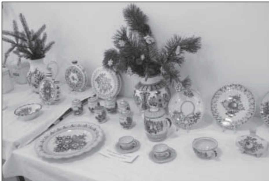
Výstava, připravená seniory

Dalšími fotografiemi se vrátím ke sklonku minulého roku. Už tradičně se v režii seniorklubu uskutečnila předvánoční výstava, tentokrát ve stylu „Bejvávalo“. Mnozí z nás tak měli možnost shlédnout opravdu povedenou přehlídku „záhadných“ a mnohdy už zapomenutých předmětů, které sloužily našim předkům ke každodennímu životu. Výstavku si také prohlédli žáci místní školy a živě se zajímali nejen o dobové fotografie, na nichž je ještě škola zobrazena jako hostinec, ale také o předměty jako je valcha, máselnice, mlýnek na kávu, konvička na mléko, petrolejka nebo školní tabulka.