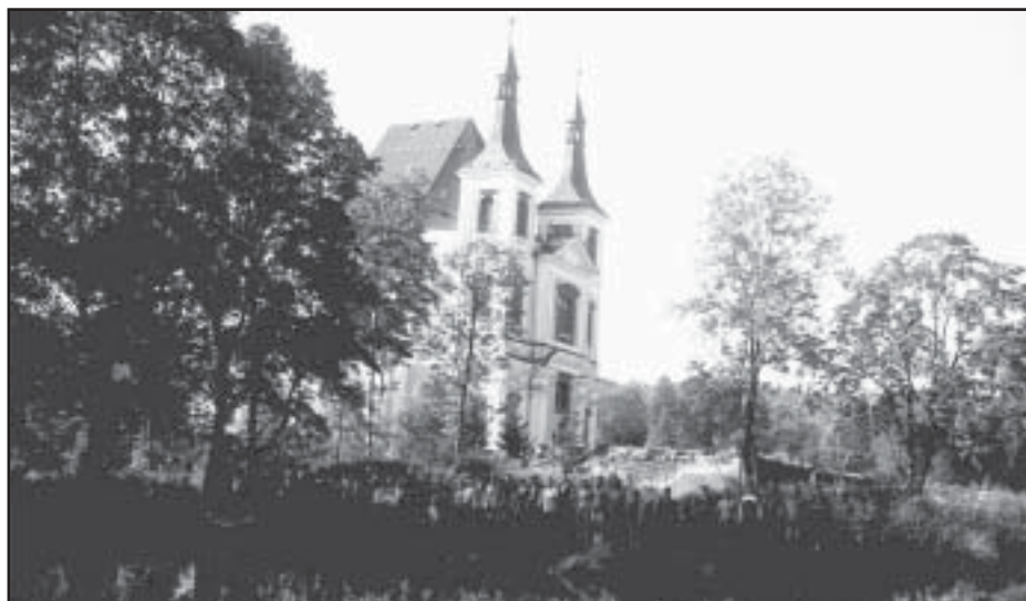
Stará Voda-pohled od obecního rybníka, který rekonstruovali právě dubští skauti

V říjnu jsme se opět zapojili do projektu „Postavme školu v Africe III“. Tato finanční sbírka má pomoci dětem z nejchudší země světa, z Etiopie získat vzdělání ve školách, které se za tyto prostředky postaví. Z obnosu prvního ročníku sbírky se postavila jedna