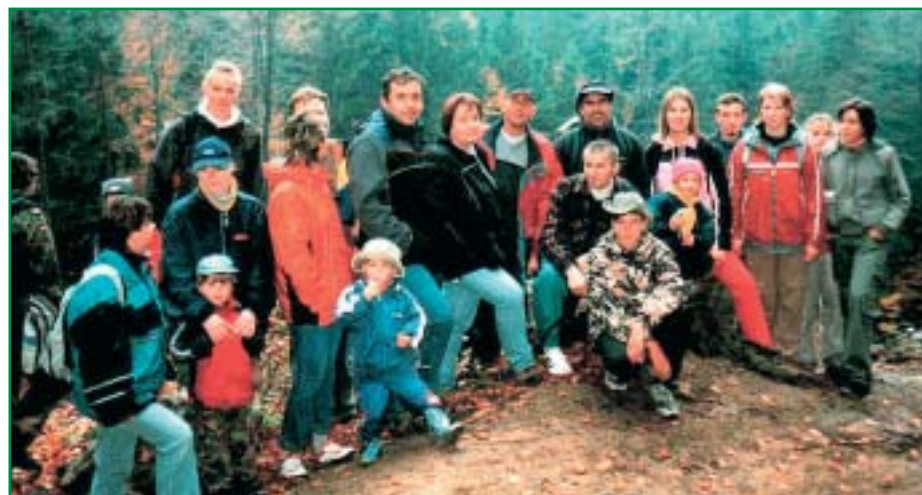
Výšlap z Tesáku na Hostýn