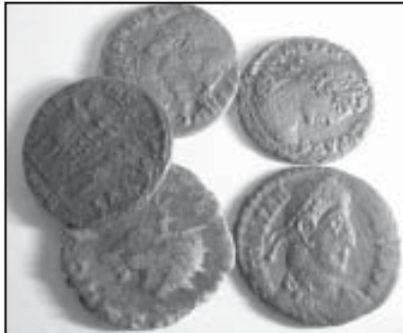
Římské mince, ražené bezmála před dvěma tisíci lety

Na burzách a aukcích se dají koupit římské bronzy za několik stokerun. Naproti tomu nález stejných mincí v určité lokalitě, v určité hloubce má z archeologického hlediska cenu obrovskou. Z toho plyne, že jen nález řádně zdokumentovaný má svou vypovídací hodnotu, hlavně o místě a vrstvě, ve které byl učiněn.