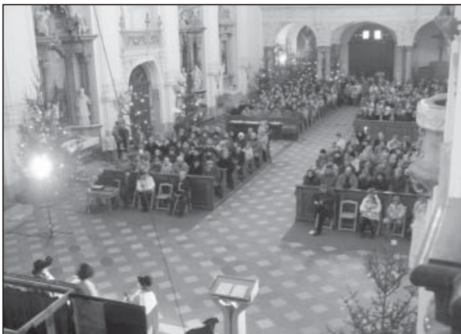
Divadlo a vánoční koncert v dubském kostele.