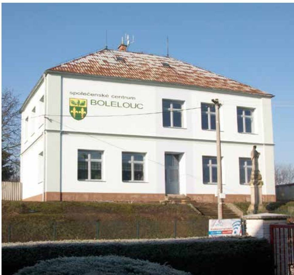
Budova bývalé ZŠ v Bolelouci v současnosti