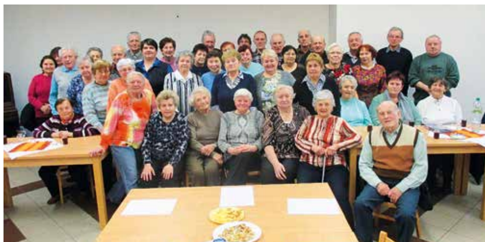
Společná fotografie seniorů z únorové schůze