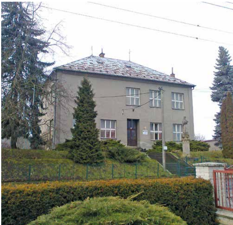
Budova bývalé ZŠ v Bolelouci před zahájením stavebních úprav