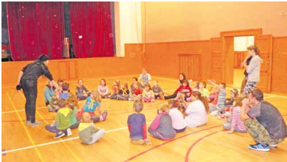
Schůzka světlušky a vlčata