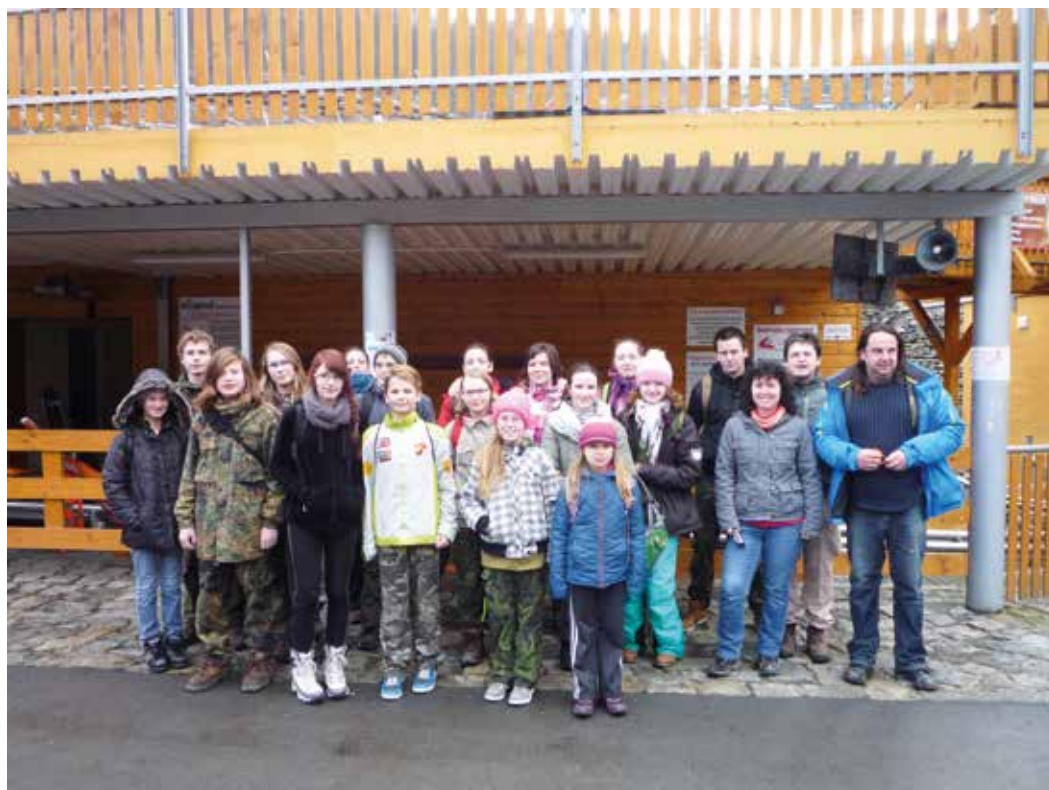
Výprava na Hrubou vodu