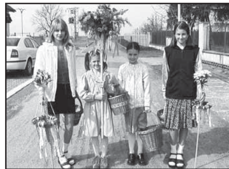
Dubská děvčata s májkou v r.2003

Menší děvčata v neděli před Velikonocemi chodívala na koledu s májkou. Před asi 65 lety je ještě vyráběla v Dubě –Borošíně stařenka Pravdová. Májku tvořila tenká hůlka, nahoře s pár snítkami smrku s ozdobně prostříhaným papírem, stužkami a hlavičkou panenky. Děvčátka pak od hodné tetičky za zpívání dostala vajíčka, kořunky i čokoládovou figurku ze Zory.