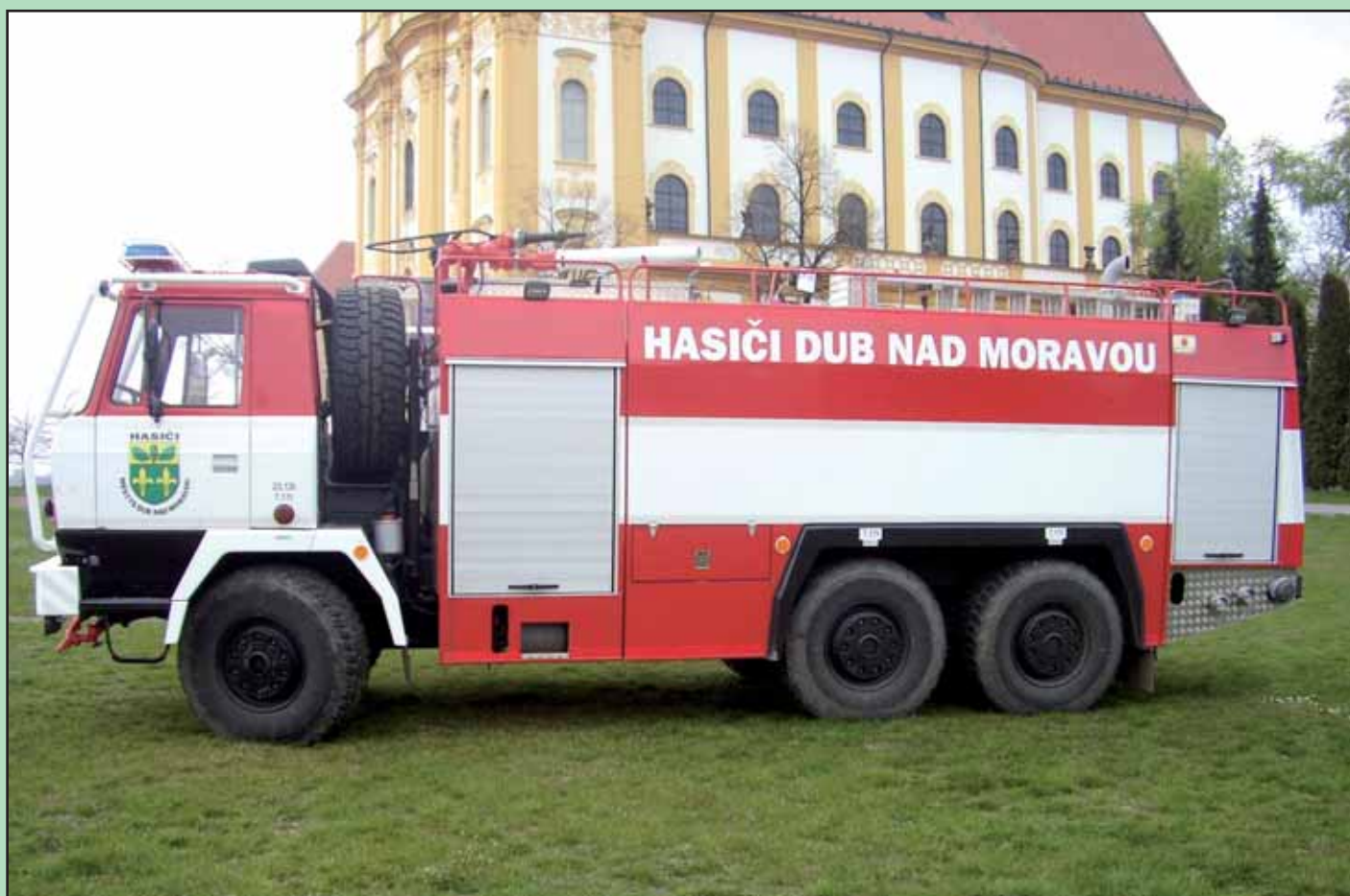
Nová posila dubských hasičů- repasované vozidlo CAS 32 Tatra 815.