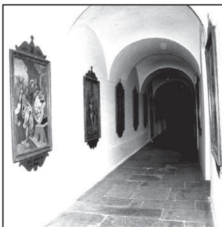
XIV. zastavení

O Křížové cestě v Dubském chrá- mu je málo známo. Do své knihy „Památník věcí minulých“ si zapsal dubský písmák, rolník Simon Doub- ravský roku 1881 jeden řádek: „Ka- pucín z Olomouce světil novou kří- žovou cestu.“ Obrazy byly umístěny v chrámové lodi. Dnes zdobí dlou- hou chodbu k chóru.