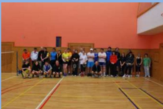
Turnaj v badmintonu