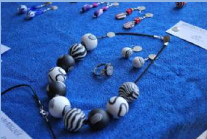
Ukázka vyrábění bižuterie