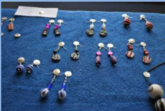
Ukázka vyrábění bižuterie