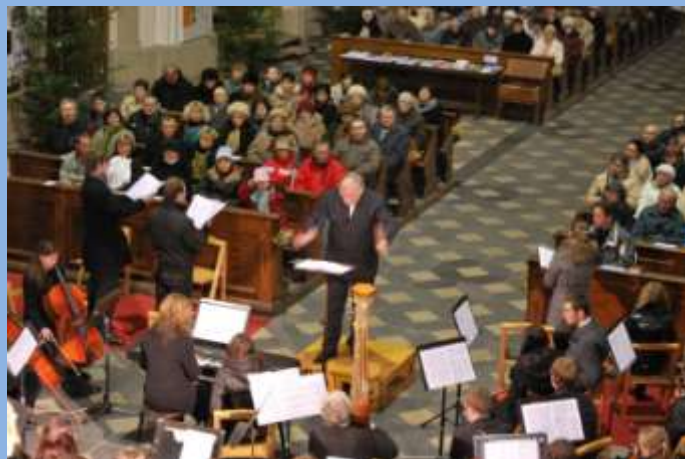
Předvánoční koncert Kroměřížské filharmonie