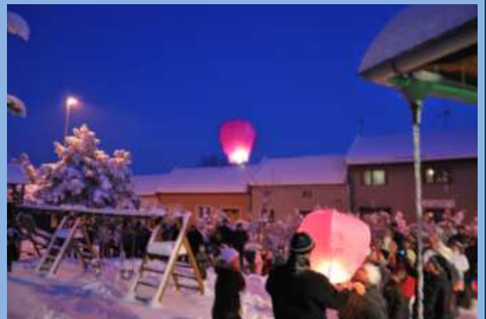
Vypuštění balonů splněných přání