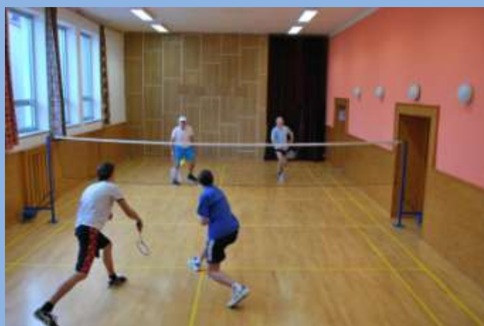
Hráči v akci

Internet na obecním úřadě v Dubu nad Moravou