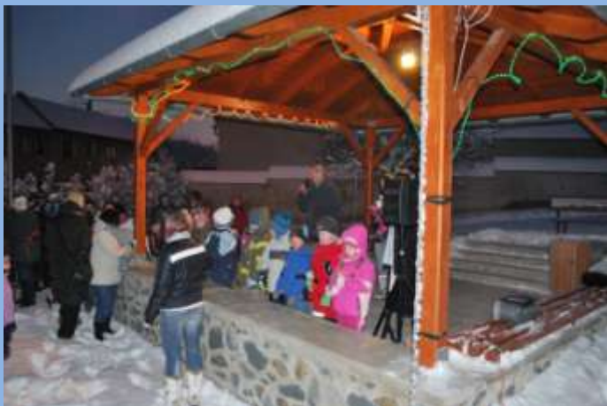
Vystoupení dětí MŠ