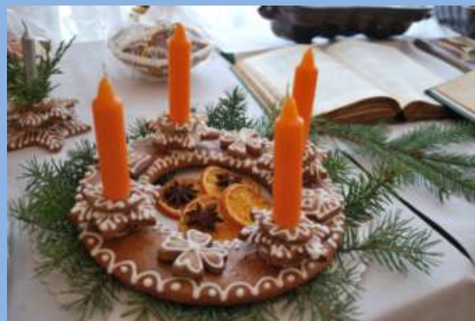
Výstava klubu seniorů