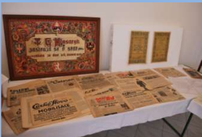
Výstava klubu seniorů