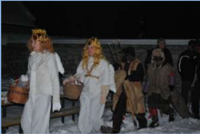
Příchod Mikulášovi družiny