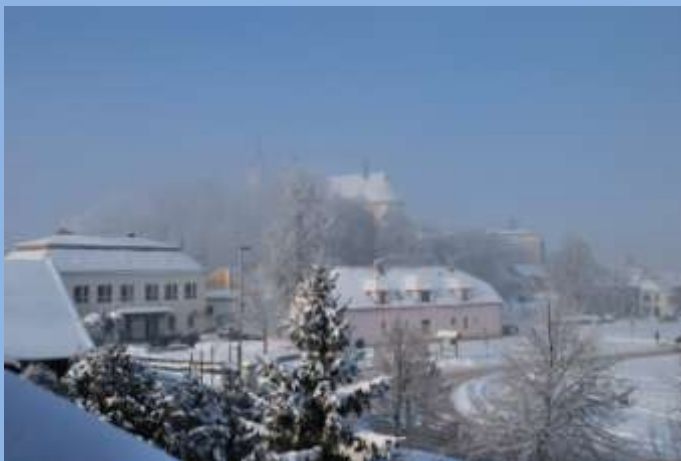
Mrazivé mikulášské počasí