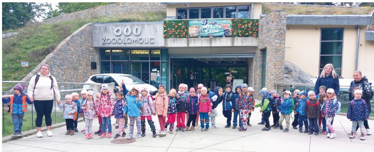
MŠ v ZOO Olomouc