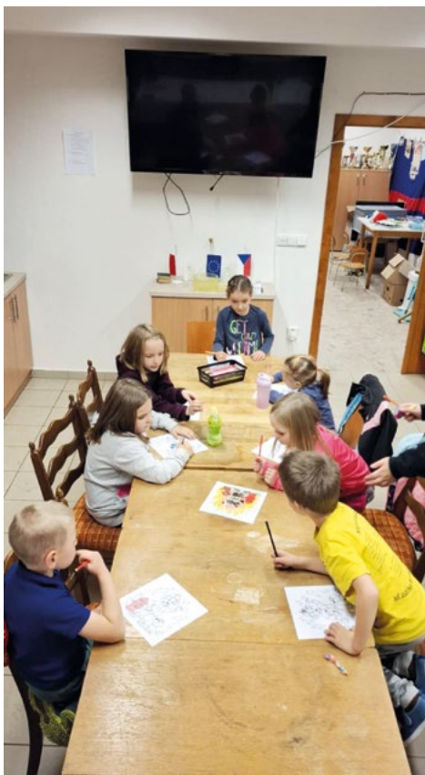
Děti v klubovně

Závěrem mi dovoluťe popřát všem krásné a klidné vánoční svátky a hodně štěstí v roce 2026.