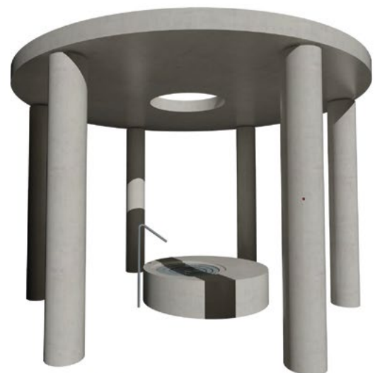
Kruhový tholos s šesti sloupy a horní deskou s otvorem bude proveden z hladkého pohledového samozhutitelného betonu. Sedací lavičky s prohlubní na vodu bude rovněž odlita z pohledového betonu s vloženou deskou z leštěného kamene.