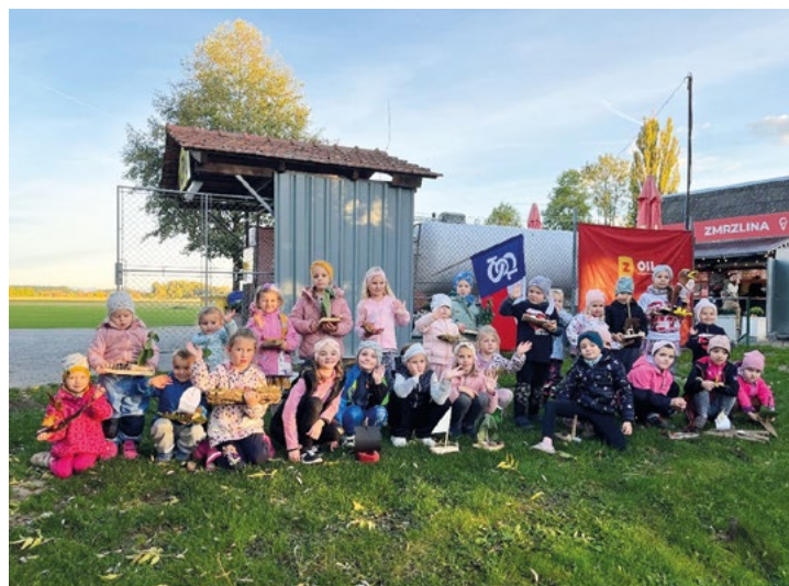
Sokolíci s lodičkami