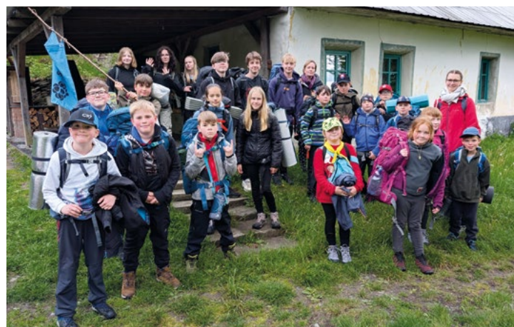
Chata v Pohořanech