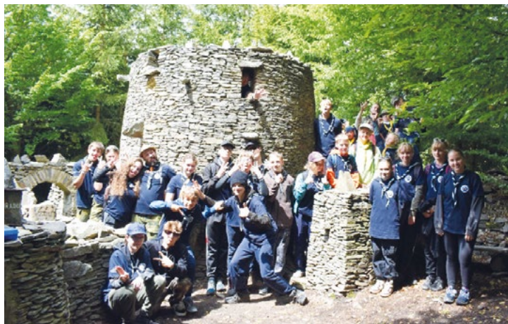
Hrádek Lipová - Špacírštejn