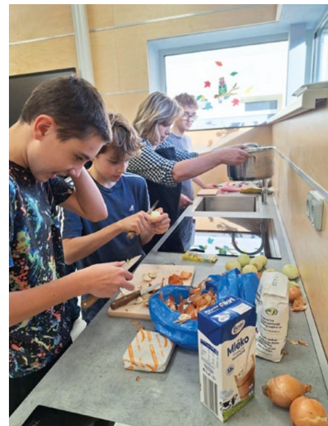
V nové jídelně