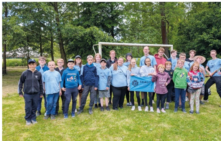
Skauti v Bolelouci